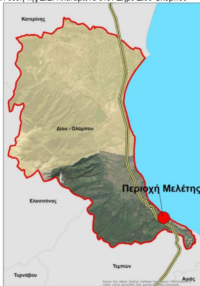
Εικόνα Α.1.1.1: Η θέση της Δ.Ε. Πλαταμώνα στον Δήμο Δίου-Ολύμπου