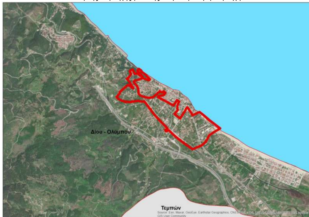
Εικόνα Α.2.1.1 : Η θέση της περιοχής μελέτης στην ευρύτερη περιοχή